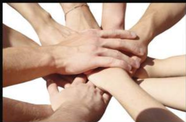
LIC. EN TRABAJO SOCIAL