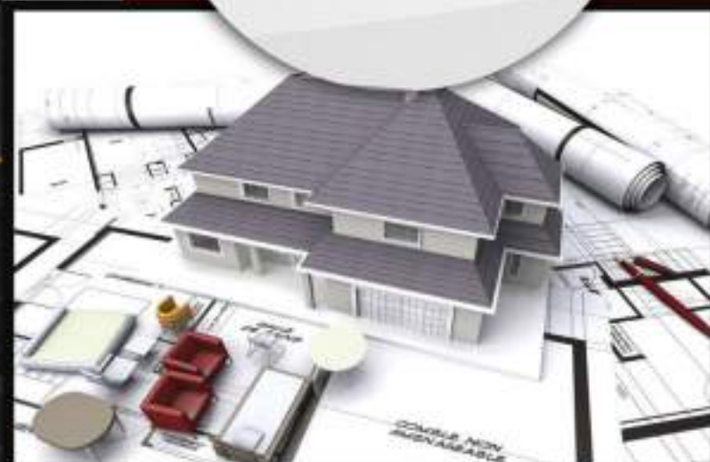
LIC. EN ARQUITECTURA