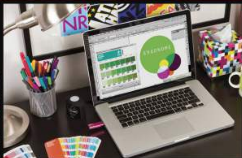
LIC. EN DISEÑO GRÁFICO