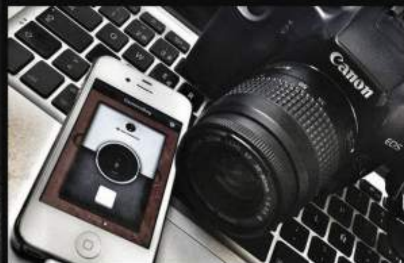
LIC. EN CIENCIAS DE LA COMUNICACIÓN Y PERIODISMO